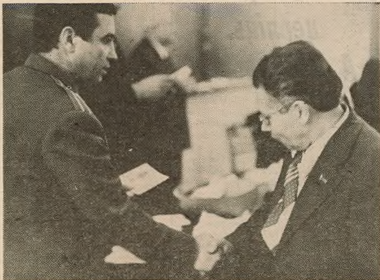
Надаўна ва ўніверсітэце адбылося ўрачыстае ўручэнне юбілейных медалёў «60 год Узброеных Сіл СССР» ветэранам Вялікай Айчыннай вайны і Узброеных Сіл СССР.

Выконваючы ленінскі план сацыялістычнай індустрыялізацыі, наша краіна за гады Савацкай улады ператварылася ў магутную індустрыяльную дзяржаву. У дарэвалюцыйнай Расіі па даных першага ўсеагульнага перапісу насельніцтва 1897 года ў гарадскіх пасяленнях пражывала толькі 15 працэнтаў жыхароў краіны, большасць насельніцтва была сельскагаспадарчай. У 1977 годзе гарадское насельніцтва складала 62 працэнты насельніцтва краіны. Доля сельскага насельніцтва скарацілася да 38 працэнтаў. У той жа час дзякуючы ўзросшаму ўзроўню механізацыі і павышэнню вытворчасці працы на сяле агульны аб'ём вытворчасці сельскагаспадарчай прадукцыі ў 1976 годзе павялічыўся ў параўнанні з дарэвалюцыйным 1913 годам у 3,3 раза.