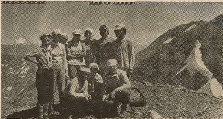
На здымку: у час паходу.