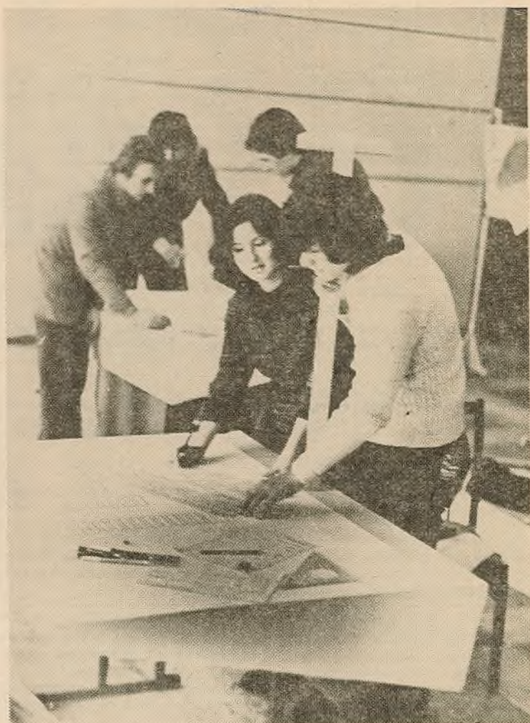
З вялікім інтарэсам уключыліся студэнты ў афармленне хола камсамольскай славы на трэцім паверсе галоўнага корпуса.

Просьба да ўсіх, хто не прайшоў перарэгістрацыю, тэрмінова зайсці ў бібліятэку (гал. корпус, 2-і паверх).