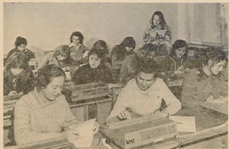
Ідучь заняткі ў класе малых вылічальных машын.

Г. АЗАРКЕВІЧ, дырэктар Таўкацэвіцкай сярэдняй школы.