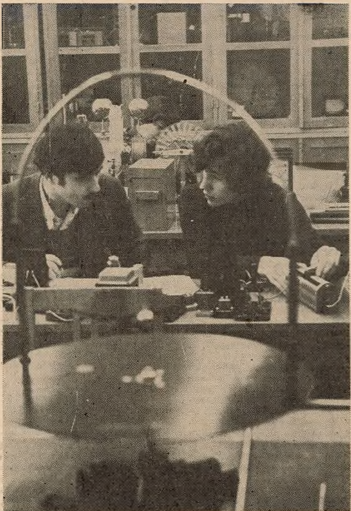
Лабараторную работу па метадыцы выкладання фізікі праводзяць чацвёртакурснікі фізічнага факультэта.