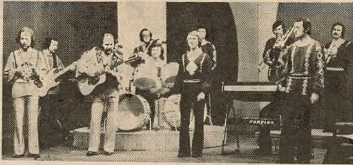
СПАТКАННЕ СА СВЕТАМ ЦУДОЎНАГА

Сёння рэдакцыя прапануе сваім чытачам матэрыял аб ансамблі. А наш пазаштатны карэспандэнт В. Маскалёў пабыў у час выступлення «Песняроў» на Беларускім тэлебачанні і зрабіў здымкі.