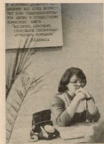
[Заканчэнне. Пачатак на 1-й стар.]

Зусім нядаўна яны слухалі і канспектавалі лекцыі, цяпер — чытаюць і вядуць семінарскія заняткі самі. Іх аўдыторыя — вучні розных школ горада Мінска.