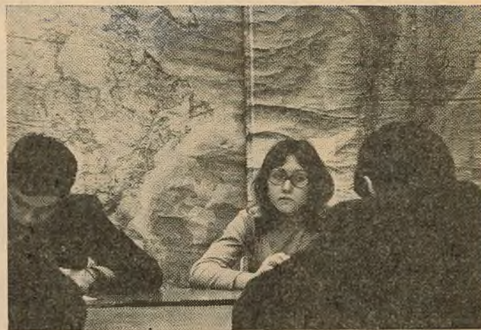
(Заканчэнне. Пачатак на 1-й стар.)

га факультэта, камп'ютэры былі б лішнія. Каб прымаці машыны — не было б гэтага матэрыялу. Упэўніўся, дацэнтаў кафедры фізічнай геаграфіі мацерыкоў і акіянаў Рылюка Георгія Якаўлевіча і Лаўрыновіч Марыю Віктараўну не замяніць і сто электронных экзаменатараў.