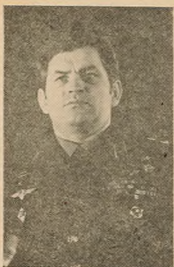
Цікавай і памятнай стала сустрэча студэнтаў БДУ з Героем Савецкага Саюза лётчыкам-касманаўтам СССР У. Кавалёнкам. НА ЗДЫМКУ: У. Кавалёнак — ганаровы баец СБА імя Ленінскага камсамола.