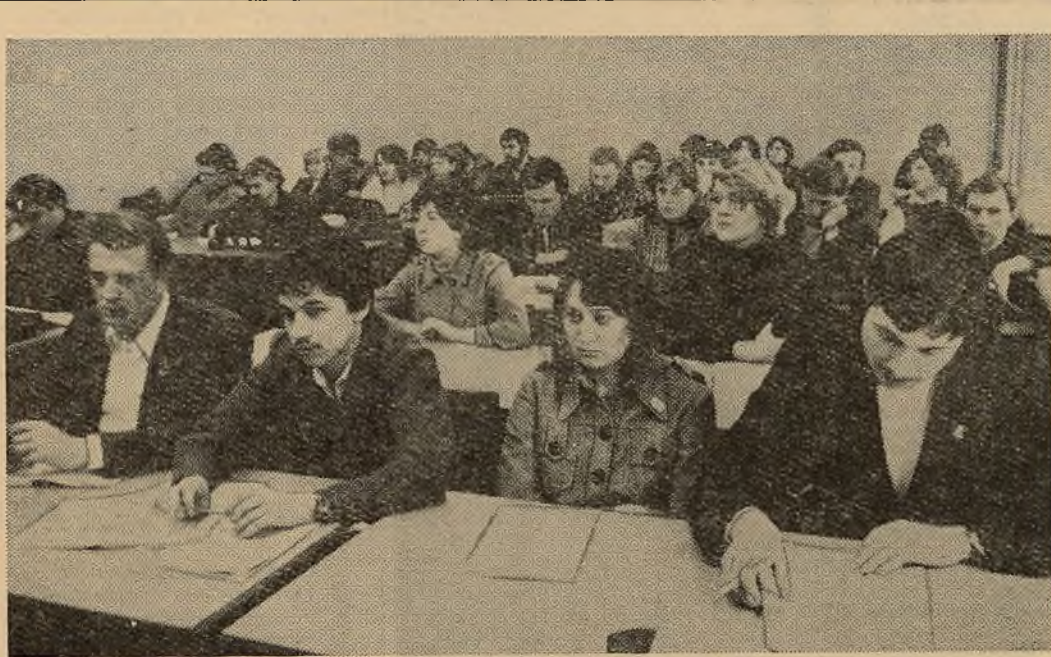
На журфаку адбылася студэнцкая навуковая канферэнцыя, прысвечаная 80-годдзю газеты «Іскра». НА ЗДЫМКУ: у час пасяджэння.

Інтэрв'ю правяла В. ВОБЛІКАВА, студэнтка факультэта журналістыкі.