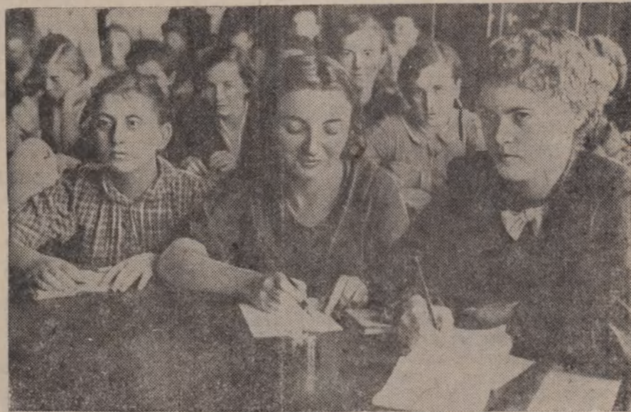
На здымку: Студэнты I курса філалагічнага факультэта ў час першай лекцыі на ўніверсітэце.

Мабілізуем усе сілы на выкананне паставленых перад савецкай вышэйшай школай адказных задач і зробім наш універсітэт сапраўды перадавай навукавай установай орэнамоўнай Беларусі.