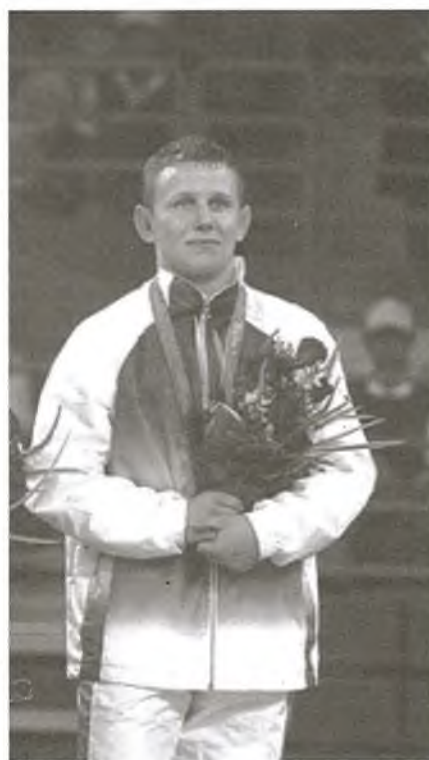
На п’едэстале: бронзавы прыёр Алімпіяды–2008 Міхаіл Сямёнаў.

А. Новік: “Міша Сямёнаў спасцігаў азы барацьбы ў сталічнай СДЮШАР № 7, а затым у Рэспубліканскім вучылішчы алімпійскага рэзерву. Пасля заканчэння РВАРа Сямёнаў паступіў на гістарычны факультэт Белдзяржуніверсітэта. Трэба сказаць, што ў галоўнай ВНУ краіны даўня барцоўскія традыцыі. Тут з поспехам працавалі заслужаны дзеяч фізічнай культуры, у мінулым чэмпіён Спартакіяды народаў СССР Віталь Фяфёлаў, заслужа-