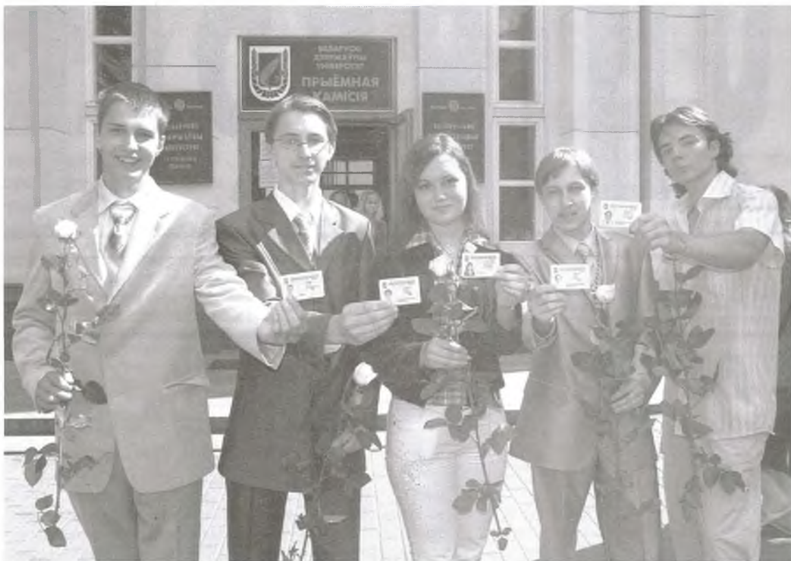
Пераможцы міжнародных алімпіяд школьнікаў па матэматыцы, хіміі і біялогіі атрымалі студэнцкія білеты на пасяджэнні прыёмнай камісіі ўжо 30 чэрвеня 2008 года.

Апрача таго, доказам добрага ўзроўню нашых абітурыентаў з’яўляецца і высокі сярэдні бал школьных атэстатаў. Канечне,