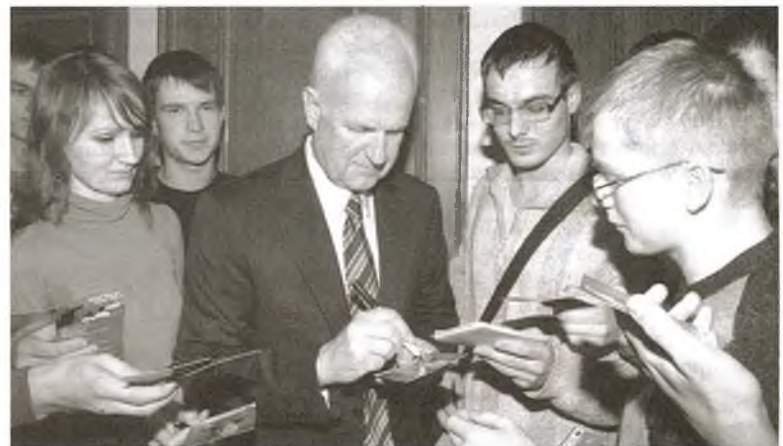
Бернд Штанге ў атачэнні прыхільнікаў-студэнтаў БДУ

Апошні месяц зімы ў студэнцкім жыцці завяршыўся яркай падзеяй: 27 лютага Бернд Штанге, трэнер нацыянальнай зборнай Беларусі па футболе, сустрэўся са студэнтамі БДУ ў будынку рэктарата.