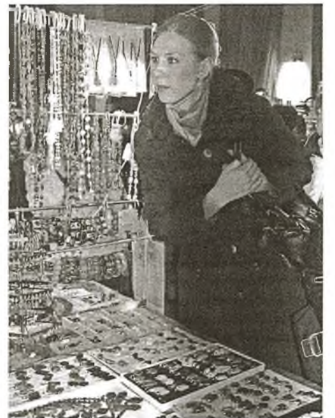
Чараўніцтва "Каменнай казкі"

Мне часта задаюць гэта пытанне. І заўсёды цяжка на яго адказаць. Як маці любіць усіх сваіх дзетак, так і я захапляюся ўсімі пародамі. Праўда, ужо даўно мне вельмі падабаюцца агаты і апалы. Апалы вельмі дарагія, бо рэдкія. Аднойчы я патрапіла на выставу апалаў у Варшаве. Там была прадстаўлена такая багатая калекцыя! Я нават баялася глыбей удыхнуць паветра, калі стаяла насупраць вітрыны. Яны мяне проста зачаравалі. Нават зараз, калі ў жыцці ўзнікаюць цяжкасці, успамінаю гэту калекцыю – і настрой паляпшаецца. Я вельмі шчаслівая, бо маю магчымасць вывучаць таямнічы свет камянёў і дзяліцца сваімі ведамі.