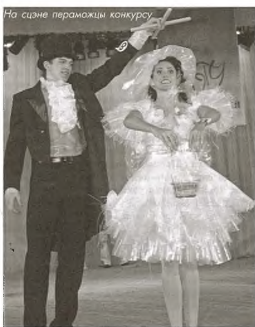
На сцэне пераможцы конкурсу

Не заспелі студэнты неспадзеўкі складаныя пытанні на конкурсе "Інтэрв'ю". "Як знайсці агульную мову са свекрыўёй?" – спытаў вядучы ў адной з канкурсантак. Яна не разгубілася: "Трэба правесці кулінарнае спаборніцтва з будучай