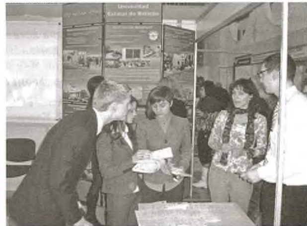
У павільёне БДУ заўсёды рухліва праца