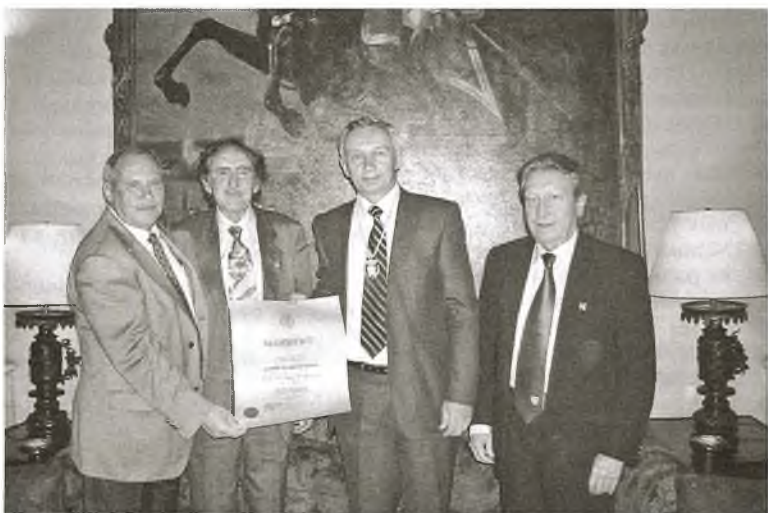
На здымку (злева направа): прафесар Віктар Краснапрошын, прэзідэнт Каралеўскай акадэміі дактароў Хасэ Касахуан Гіберт, рэктар БДУ акадэмік Сяргей Абламейка і прэзідэнт Іспанскай акадэміі эканомікі і фінансаў Хайме Хіль Алуха

Апошнім часам кантакты кіраўніцтва Белдзяржуніверсітэта з замежнымі калегамі, можна смела казаць, развіваюцца імкліва і з вялікай перспектывай – тым самым яны садзейнічаюць умацаванню аўтарытэту нашай ВУ ў Еўропе. Пасля "заваявання" Апенін (шэраг пагадненняў у Італіі) БДУ асвойтаўся на Пірэнейскім паўвостраве.