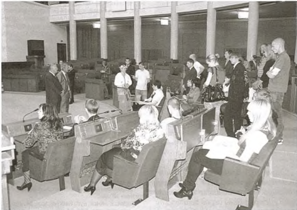
Удзельнікі студэнцкага дыскусійна-палітычнага клуба на экскурсіі ў будынку парламента

"Актыўная грамадзянская пазіцыя – важны складнік моладзевай культуры", – адзначыла на нядаўняй канферэнцыі па пытаннях вышэйшай адукацыі ў рамках Саюзнай дзяржавы акадэмік РАА Ірына Зімяня. Нібыта ў пацвярджэнне яе слоў у нашай ВНУ ўзнікла студэнцкая суполка Дыскусійна-палітычны клуб пры БРСМ БДУ. Мы вучыліся быць годнымі лідарамі – зараз мы навучымся быць здольнымі палітыкамі.