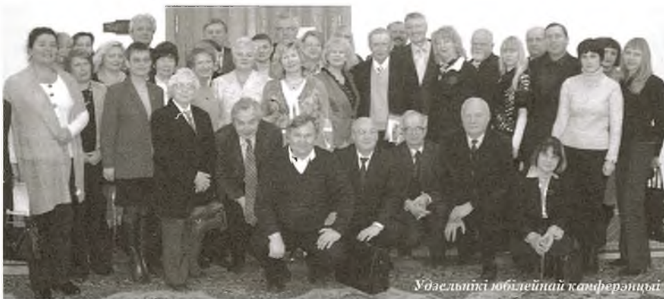
Удзельнікі юбілейнай канферэнцыі

Кафедра сацыялогіі ФФСН БДУ на сёння пакуль адзіная ў вышэйшай школе Беларусі, хоць сацыялогія адносіцца да адной з асноўных агульнаадукацыйных дысцыплін ва ўсіх ВНУ. І універсітэцкія сацыялагі дапамагаюць у выкладанні гэтага прадмета.