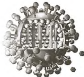
Трохмерная мадэль віруса А/Н1Н1

З тэмпературай 38, а тым больш 39 градусаў, абавязкова трэба выклікаць урача. І не толькі таму, што для здаровых людзей існуе небяспека заражэння. Да прыходу ўрача рэкамендуецца піць вялікую колькасць