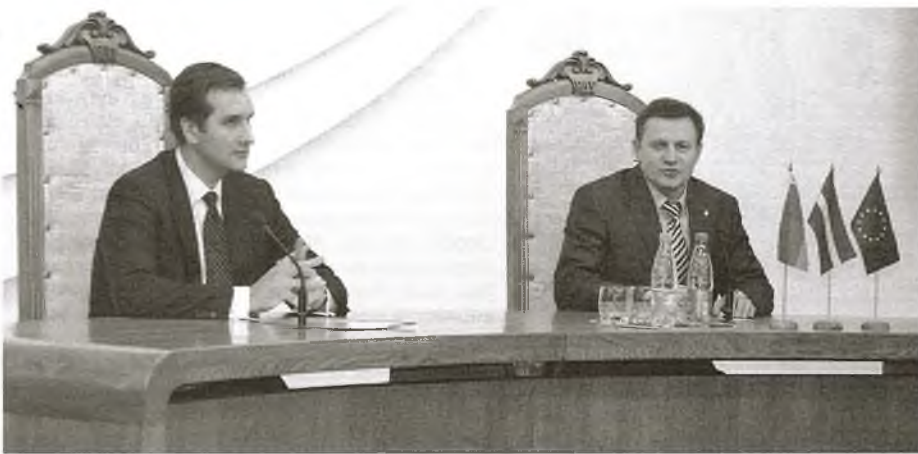
На здымку: міністр замежных спраў Латвіі Марыс Рыекстыньш (злева) і першы прарэктар БДУ прафесар Міхаіл Жураўкоў

Наша рэспубліка, як вядома, у сакавіку гэтага года стала ўдзельнікам праграмы "Усходняе партнёрства", якая прадугледжвае эканамічную інтэграцыю і палітычнае збліжэнне ЕС з 6 дзяржавамі: Азербайджанам, Армэніяй, Беларуссю, Грузіяй, Малдовай і Украінай. Латвія – член Еўрапейскага саюза з 2004 г. Па словах Марыса Рыекстыньшы, Рыга была актыўным прыхільнікам