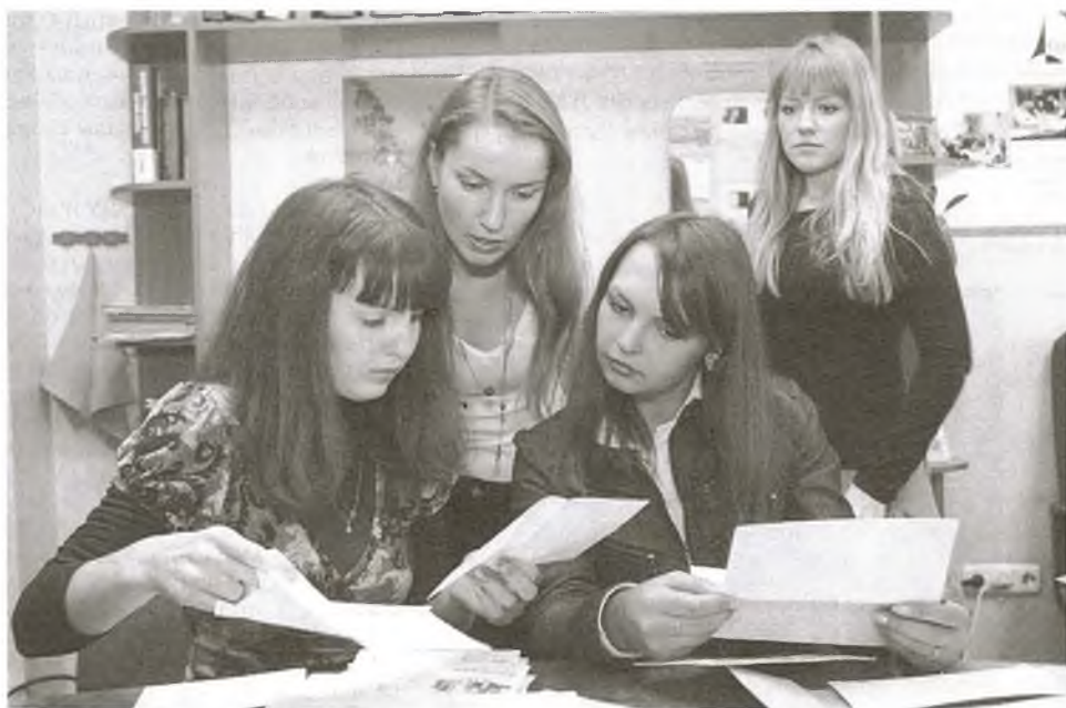
Студэнты-правазнаўцы ў юрыдычнай клініцы прымяняюць свае веды на практыцы

“Юрыдычная клініка БДУ” ўзнікла на пачатку XXI стагоддзя як праект, падтрыманы Праграмай развіцця ААН у Рэспубліцы Беларусь і Прадстаўніцтвам Упраўлення Вярхоўнага камісара ААН па справах бежанцаў. У 2003 г. з праекта яна была пераўтворана ў арганізацыйную структуру юрыдычнага факультэта – вучэбную лабараторыю. Гэта пацвярджае яе важнасць для нашай навучальнай установы.