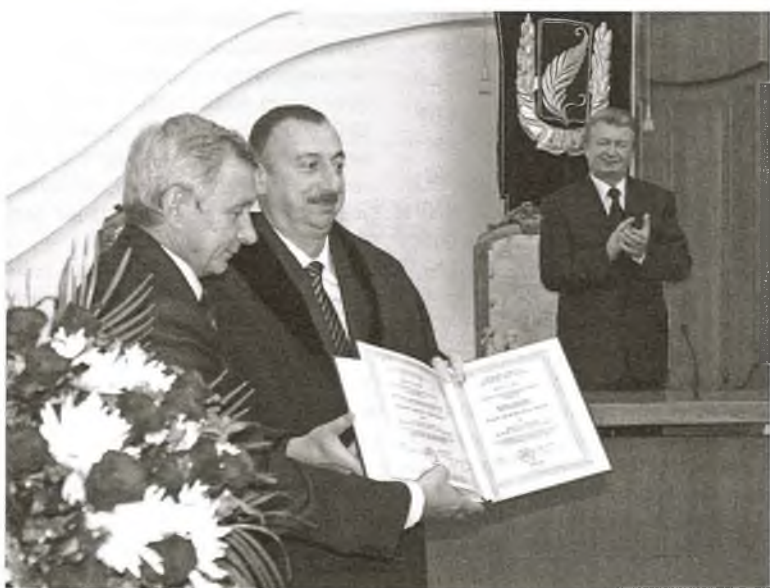
Рэктар акадэмік Сяргей Абламейка ўручае дыплом ганаровага прафесара БДУ прэзідэнту Азербайджанскай Рэспублікі Ільхаму Аліеву

Дыплом "Ганаровы прафесар БДУ" быў уручаны 12 лістапада рэктарам Беларускага дзяржаўнага ўніверсітэта акадэмікам Сяргеем Абламейкам прэзідэнту Азербайджана Ільхаму Аліеву, які наведаў нашу краіну з афіцыйным візітам.