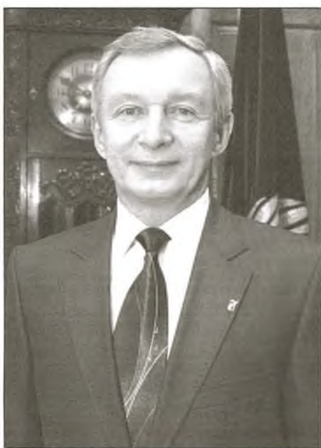
Рэктар Беларускага дзяржаўнага ўніверсітэта акадэмік Сяргей Уладзіміравіч АБЛАМЕЙКА

Ва ўніверсітэце пастаянна вядзецца пошук новых метадаў і тэхналогій выкладання і арганізацыі