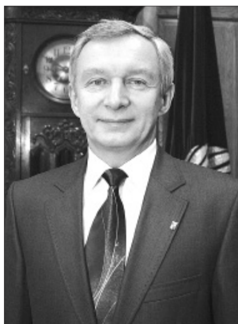
Рэктар Беларускага дзяржаўнага ўніверсітэта акадэмік Сяргей Уладзіміравіч АБЛАМЕЙКА

Ва ўніверсітэце пастаянна вядзецца пошук новых метадаў і тэхналогій выкладання і арганізацыі навучальнага працэсу, якія скіраваны на стварэнне ўмоў для самастойнага набыцця ведаў пры кансультацыях і пад кантролем кваліфікаваных выкладчыкаў. Арганізацыя навучальна-