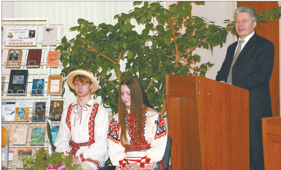
Сяргей Масквевіч: «Наша задача – шанаваць і развіваць родную мову!»

У «афіцыйны» дзень, 21 лютага, на філфак завіталі міністр адукацыі Беларусі Сяргей Масквевіч , рэктар БДУ адэмкі Сяргей Абламейка , дырэктар Інстытута мовы і літаратуры імя Якуба Коласа і Янкі Купалы НАНБ Аляксандр Лукашанец і аўтар дзяржаўнага гімна нашай краіны Уладзімір Карызна . Дэкан філалагічнага факультэта пра-