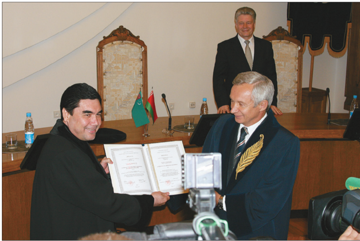
Прэзідэнт Туркменістана Гурбангулы Бердымухамедаў атрымлівае дыплом ганаровага прафесара ад рэктара БДУ Сяргея Абламейкі

Па словах рэктара БДУ акадэміка Сяргея Абламейкі, Гурбангулы Бердымухамедаў ушанаваны званнем «Ганаровы прафесар БДУ» рашэннем Вучонага савета за развіццё навукі, двухбаковых беларуска-туркменскіх адносін, умацаванне культурных і адукацыйных сувязяў. У сваім выступленні перад выкладчыкамі і студэнтамі Гурбангулы Бердымухамедаў распавёў, што Беларусь і Туркменістан вядуць актыўны палітычны дыялог, а таваразварот павялічваецца ў разы. Надоечы з кіраўніцтвам нашай краіны падпісаны вялікі пакет дамоў у сферы навукі, адукацыі і аховы здароўя. «БДУ – буйная, вядомая ў свеце ВНУ, якая аказала значны ўплыў на развіццё сусветнай навукі», – адзначыў туркменскі лідар і заклікаў беларускіх спецыялістаў актыўна далучацца да рэалізацыі сумесных праграм у галіне нафтаперапрацоўкі, нанаматэрыялаў і турызму. Дарэчы, Туркменістан займае чацвёртае