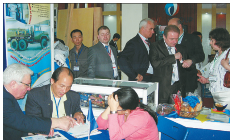
Падчас працы кірмашу з экспазіцыяй універсітэта азнаёміўся намеснік міністра гандлю Рэспублікі Беларусь Э. Б. Матуліс