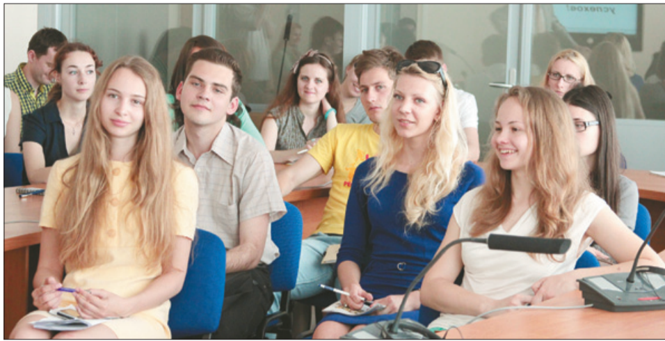
Студэнты БДУ збіраюцца на стажыроўку ў Еўропу па праграме Erasmus Mundus

Разам з супрацоўніцтвам паміж ВНУ ў БДУ дзейнічаюць міжнародныя праграмы, у рамках якіх студэнты маюць магчымасць навучацца на працягу 1–2 семестраў за мяжой, прымаць удзел у летніх школах, семінарах, праходзіць навуковыя стажыроўкі і вытворчую практыку. Можна вылучыць праграмы Германскай службы акадэмічных абменаў DAAD, праграму Шведскага інстытута Visby, праграму Фінскага цэнтру міжнароднай мабільнасці СІМО, стыпендыяльныя праграмы Вышградскага фонду, праграму абмену студэнтаў тэхнічных спецыяльнасцяў ІАЕСТЕ, праграму Сеткавага ўніверсітэта СНД, а таксама многія іншыя. Адапаведная інфар-