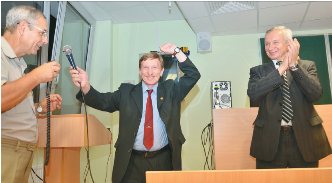
5 чэрвеня, 00.02. «Прывітанне! Мы вас чуюм» – ёсць кантакт з МКС