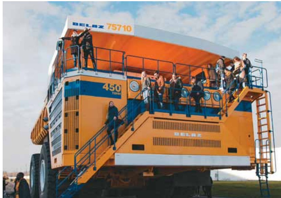
Удзельнікі моладзевага форуму знаёмяцца з габарытнай прадукцыяй БелАЗа

мжнароднага супрацоўніцтва» – вось ён, той самы вялікі спіс самых актуальных студэнцкіх пытанняў. Кожную секцыю вёў старшыня адной са студэнцкіх арганізацый БДУ. Секцыі праходзілі як у фармаце дакладаў, так і ў фармаце гутаркі, а некаторыя нават сумяшчалі і тое, і другое. Так што ад удзельнікаў патрабавалася толькі зацікаўленасць тэмай, а як вы яе абмяркуеце – справа іншая.