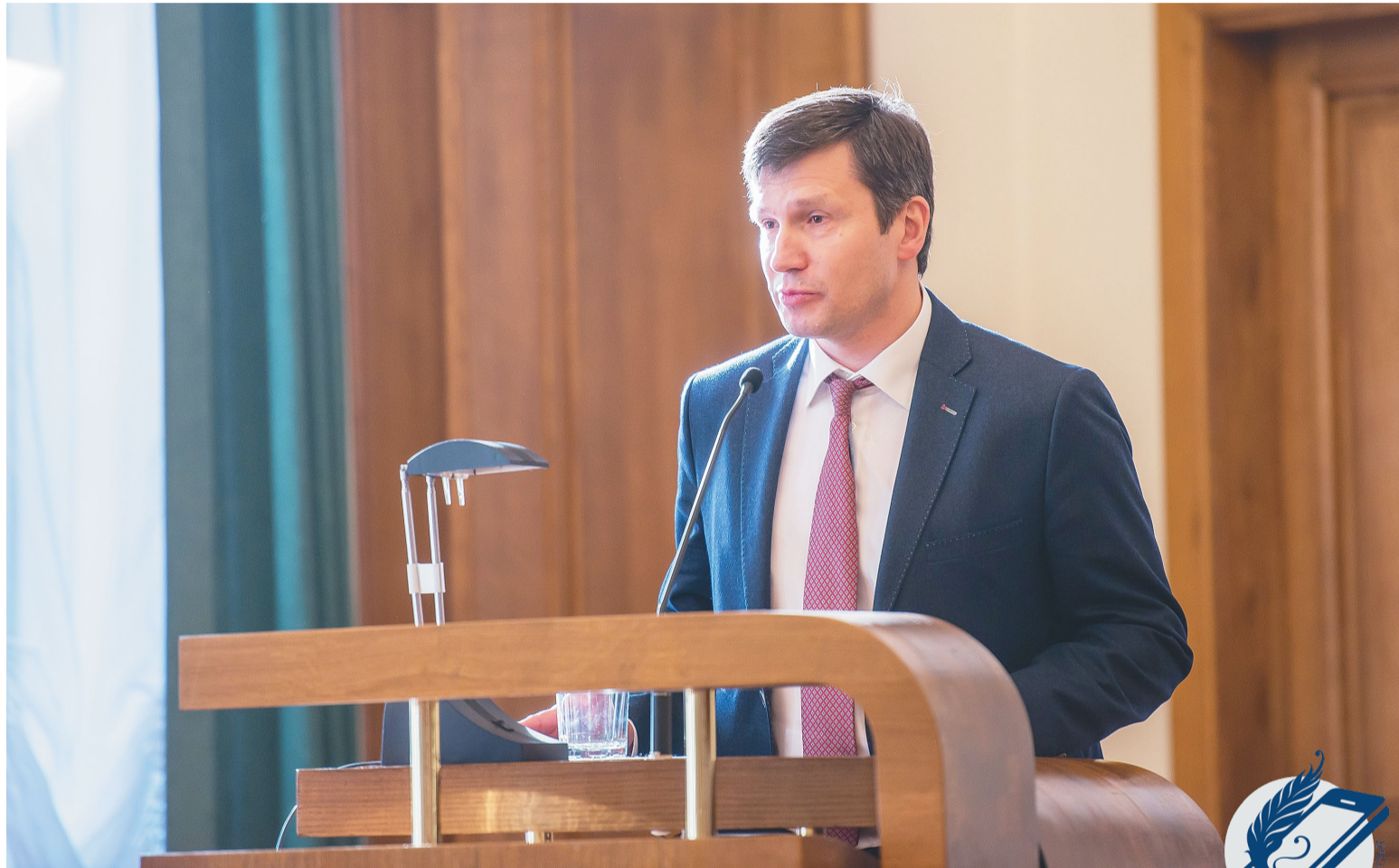
Новы рэктар БДУ – Андрэй Дзмітрыевіч Кароль