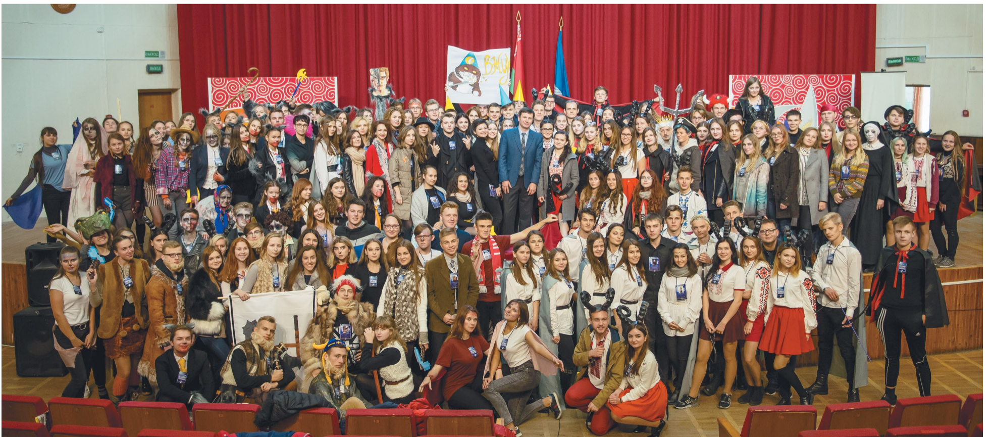
Самай галоўнай падзеяй «Школы стараст» стала першая сустрэча студэнтаў з новым рэктарам БДУ Андрэем Каралём

*Падрабязна пазнаёміцца з гутаркай рэктара са студэнтамі можна сайце БДУ www.bsu.by ў раздзеле «Навіны» з адпаведных відэасюжэтаў