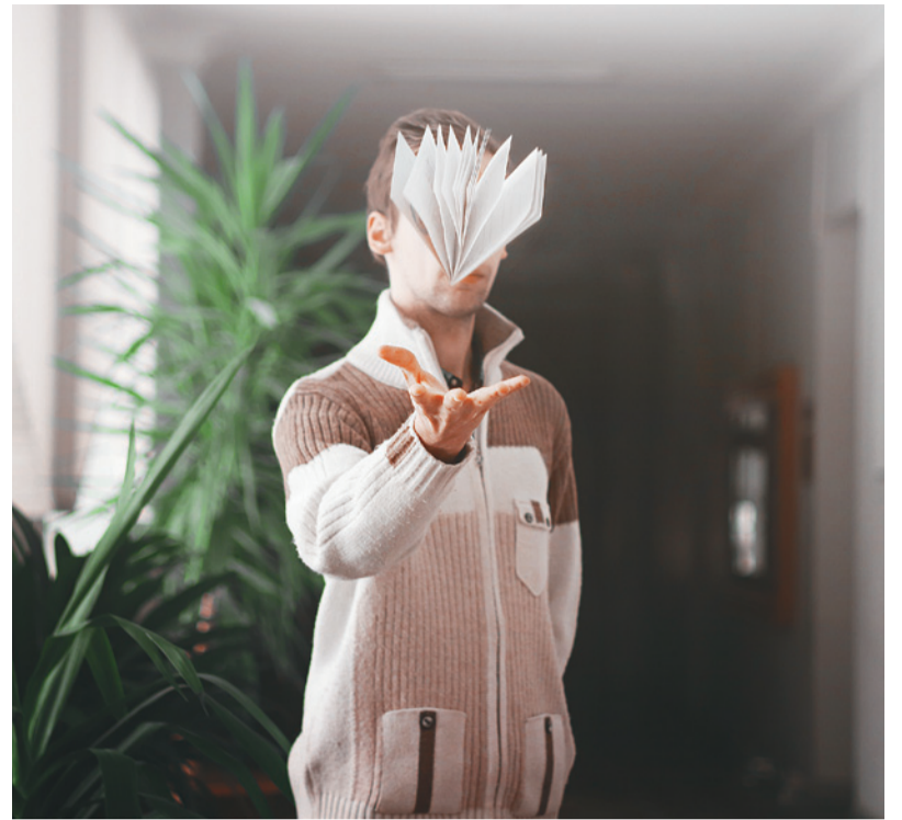
«Фота «сесія».

21 сакавіка журы Студэнцкага саюза падвяло вынікі штогадовага фотаконкурсу «БДУ ў тваім фармаце» і ўзнагародзіла пераможцаў. Таксама арганізатары падрыхтавалі для ўдзельнікаў і гасцей сустрэчу з зорным гасцем і прагляд фільма.