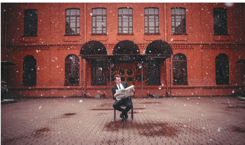
«БДУ як брэнд».