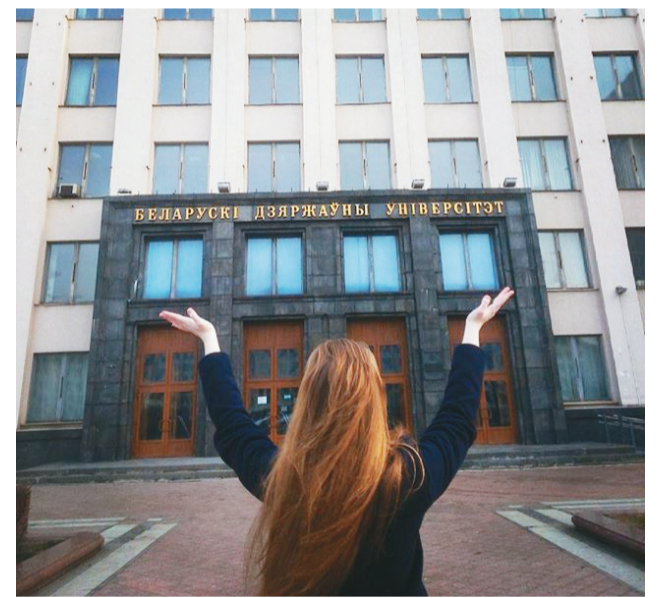
«Я частка БДУ».