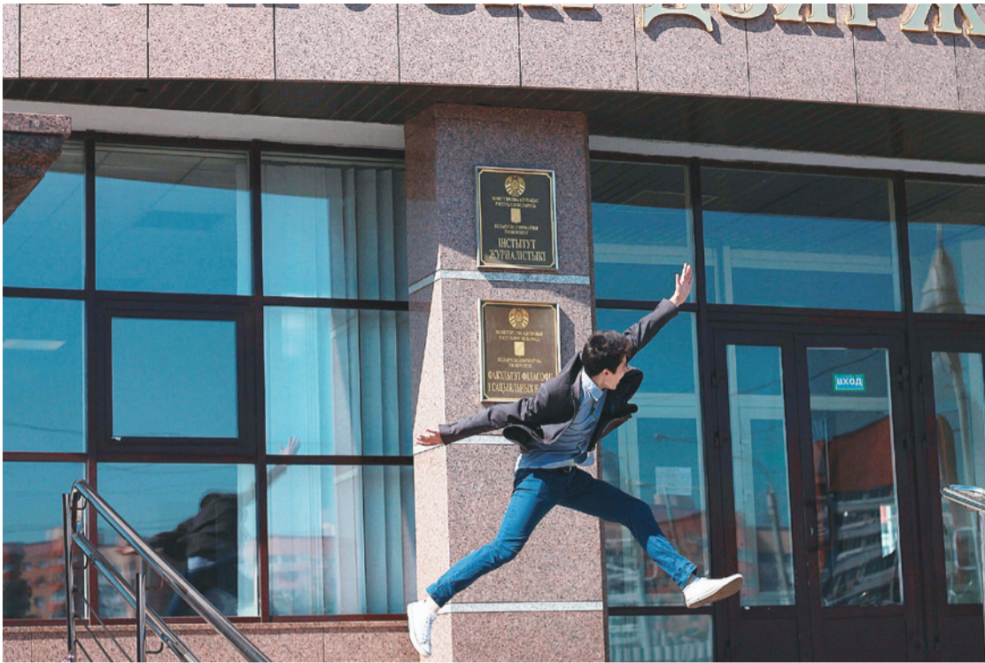
«БДУ ў эмоцыях».