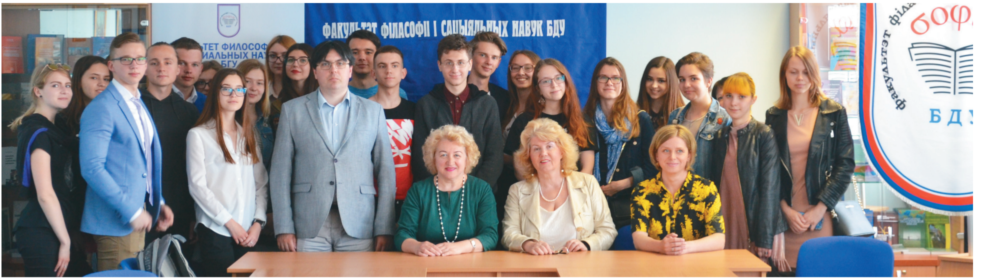
Тэлемент з Дзяржаўным музеем-запаведнікам «Растойскі крэ́мль» у рамках акцыі ЮНЕСКА, прысвечанай Сусветнаму дню культурнай разнастайнасці. 2018 год