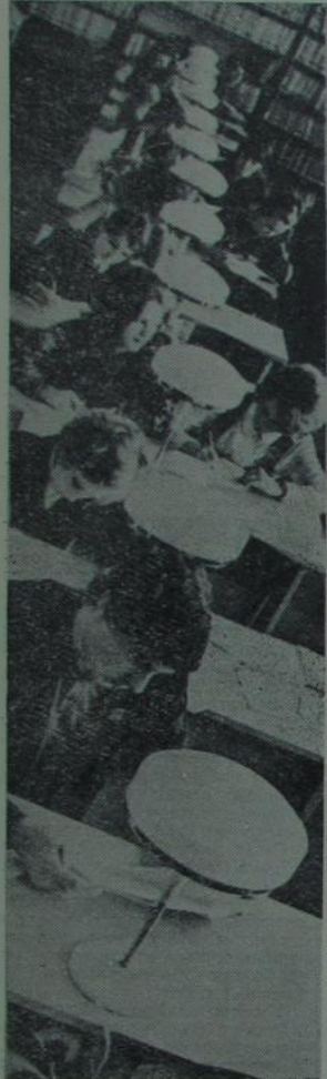
У новай чытальнай зале.