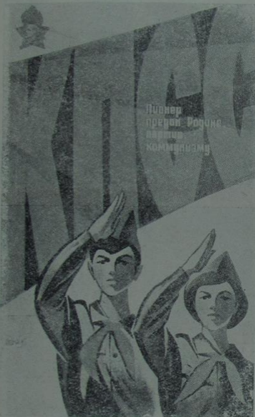
Піонер прэмія Родзіна дартш коммунізму