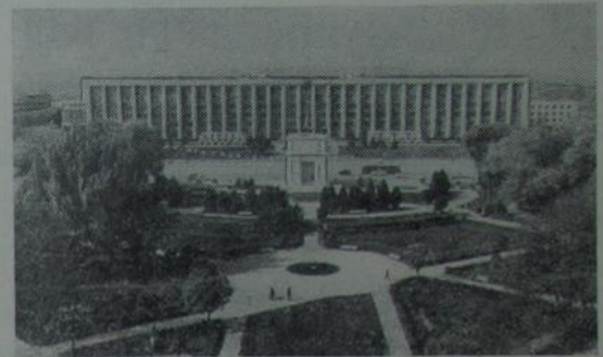
Плошча Перамогі.

Пры пастаяннай і бескарывай дапамозе народаў краіны працоўныя Малдавіі з году ў год павялічвалі тэмпы развіцця эканомікі. У індустрыяльнае аблчча сённяшняй Малдавіі часткова шчодрой душы і таленту ўклали ўсе брацкія народы. І гэты бескарывы ўклад яшчэ больш цэментавалі дружбу. Росквіт Савецкай Малдавіі — вынік сумеснай барацьбы і працы усіх брацкіх народаў нашай шматнацыянальнай Радзімы.